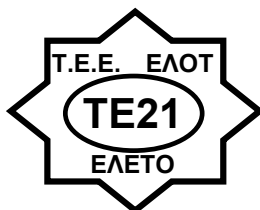
ΕΛΟΤ/ΤΕ21 «ΟΡΟΛΟΓΙΑ – ΓΛΩΣΣΙΚΟΙ ΠΟΡΟΙ»